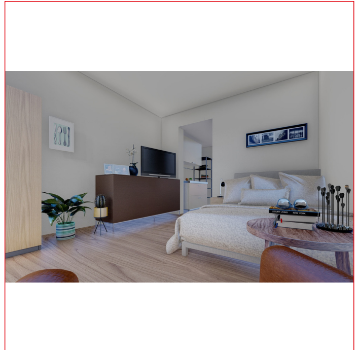
Einrichtungsbeispiel WohnPlus Apartment